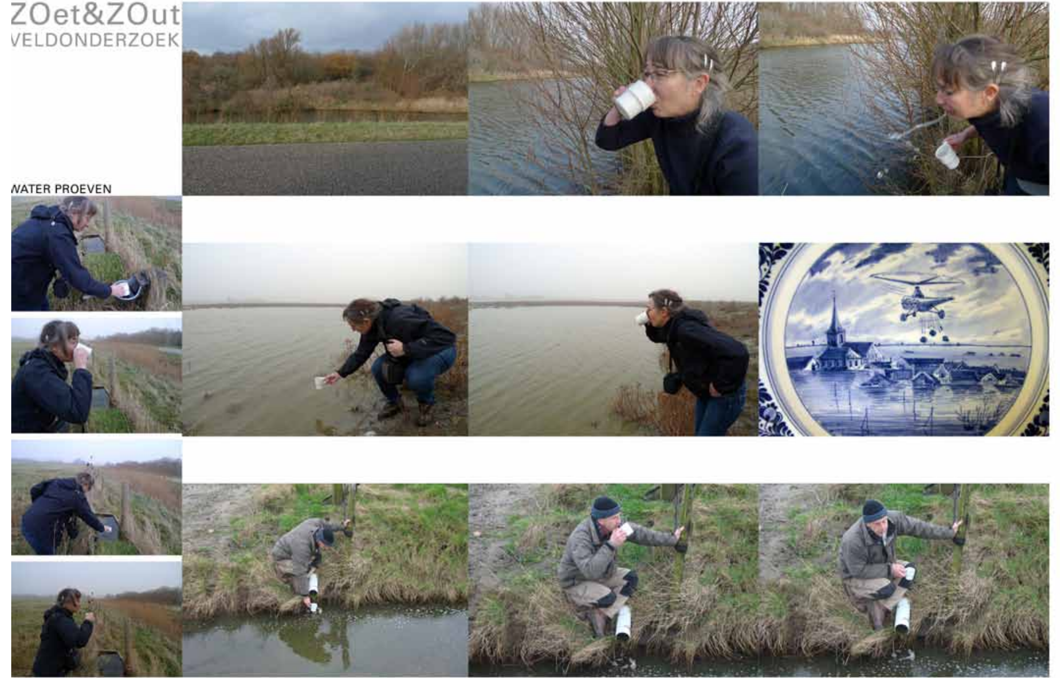
BEWAERSCHOLE | Burgh-Haamstede