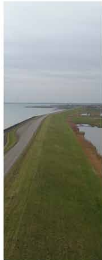
BEWAERSCHOLE | Burgh-Haamstede