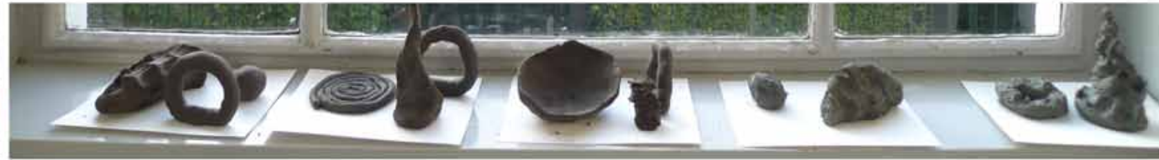
BEWAERSCHOLE | Burgh-Haamstede