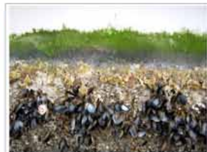
het onderwaterleven vormt zijn eigen landschap van pokken mossen soorten zandpan en algen een meer: oostervalle van reikt met aquari gevoel door de glijden