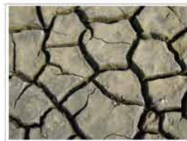
Van geschied van droogte kleeft geboon van hangenmoed klimaatverandering aan: in zouten puilt versuifelen aan dieke doedden houdt water vast mensken stukt gebonden vordewijg