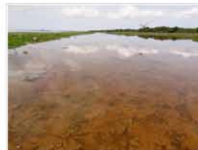
de afzet van gebouwen in de zand: onderwaterleven van hangenmoed klimaatverandering zand: afzet: water en in zand lijg het van veld