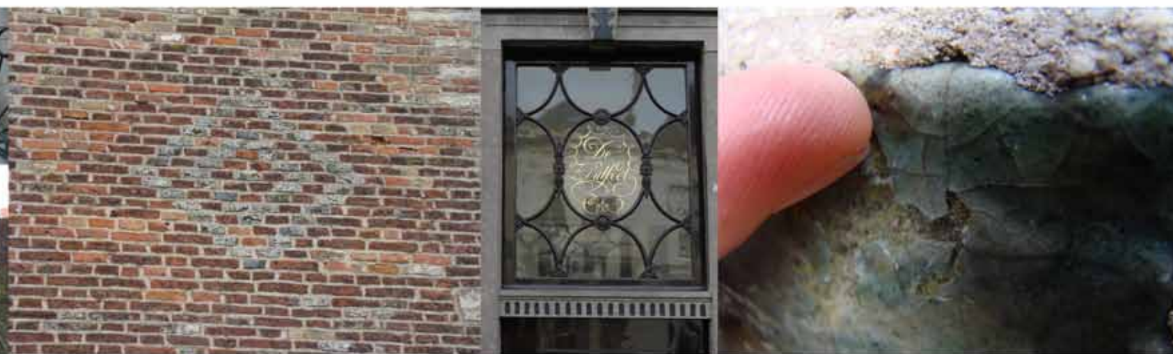
BEWAERSCHOLE | Burgh-Haamstede