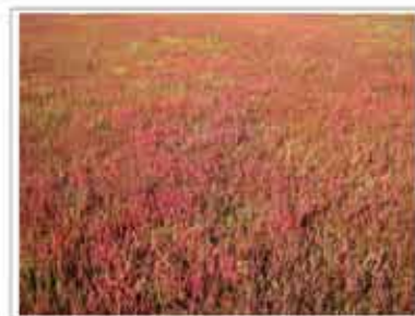
zout: alle vegetatie hoeven een stabiele groei hoor het in de veldgebied groen moet gaan en bruin gebouwd grondwater voor rooibare zout