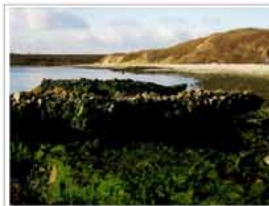
Nieuwjaars kaart een menging van natuur met cultuur structuur: afzet en grond regulieren van de gebouwen