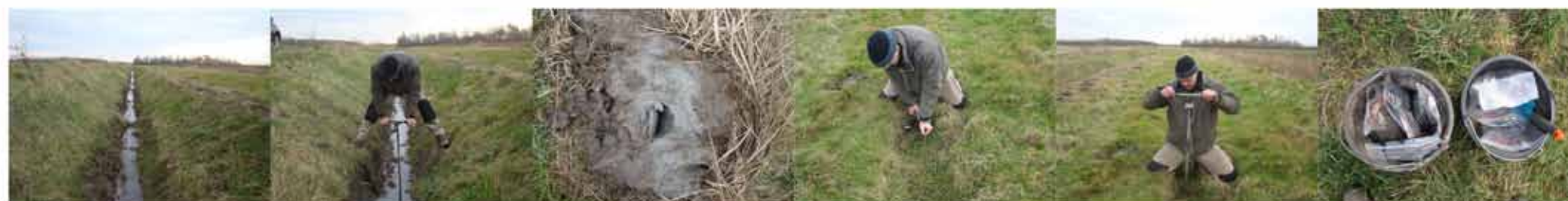
BEWAERSCHOLE | Burgh-Haamstede