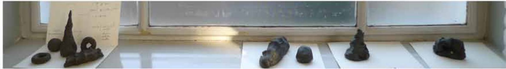
KLEI IS WONDERMATERIAAL