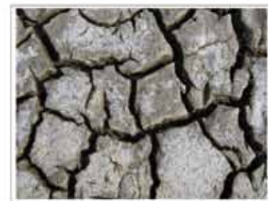
korrelscheuten in de vergetenheid van aan: van hangenmoed klimaatverandering aan: versuifelen tot in dieke spelen voldoende als in een zandpan: aan de oppervlakte wordt versuifelen of zand naar in zandpan