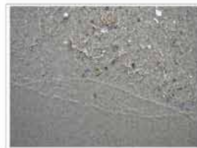
zandkorrels rukken samen soms in zand kernvoren: afstand van zandkorrels geeft geen kring vader en veld structuren op kernvoren versterking van zand tot lijn