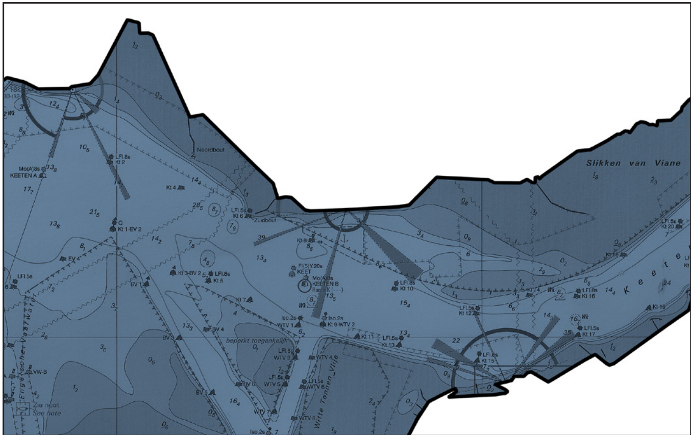
diepte Oosterschelde ter hoogte van Slikken van Viane