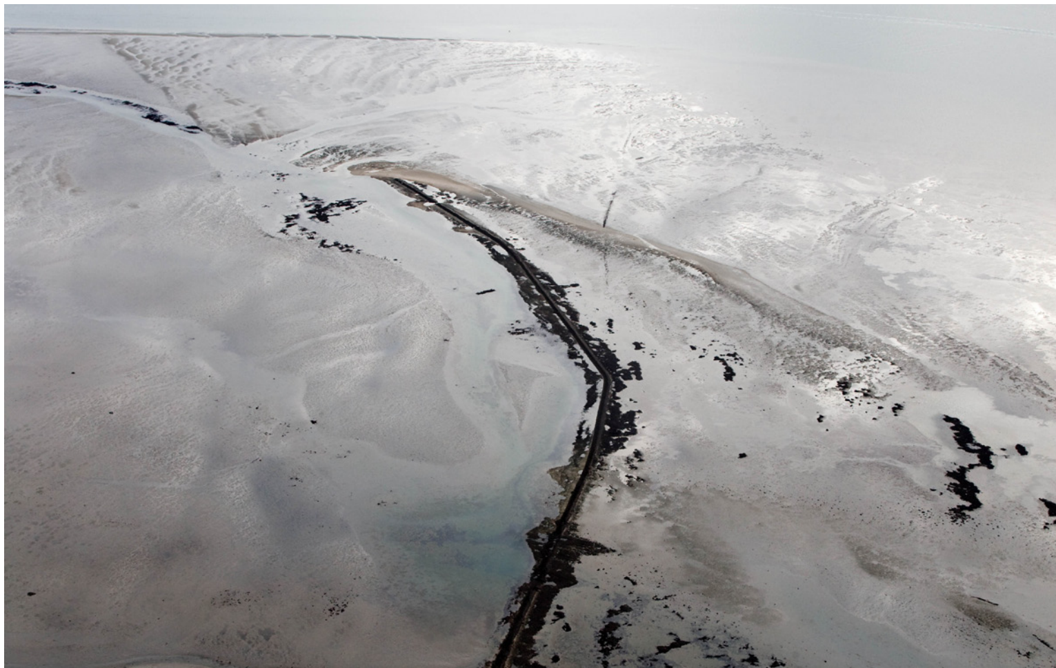
Luchtfoto Slikken van Viane

Bij de eerste veldwerk week hebben we op een drietal locaties de overgangen tussen land & water op Schouwen Duiveland bestudeerd. Hierbij is vooral gekeken naar een drietal locaties waarbij telkens een andere wisselwerking tussen land, water en menselijke ingreep voelbaar en zichtbaar is. Hoe is voelbare relatie van het land tot het water telkens weer anders? Wat speelt er zich juist af op de grens tussen land en water?